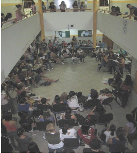
Assembléia Geral PURO - 05 de maio de 2011