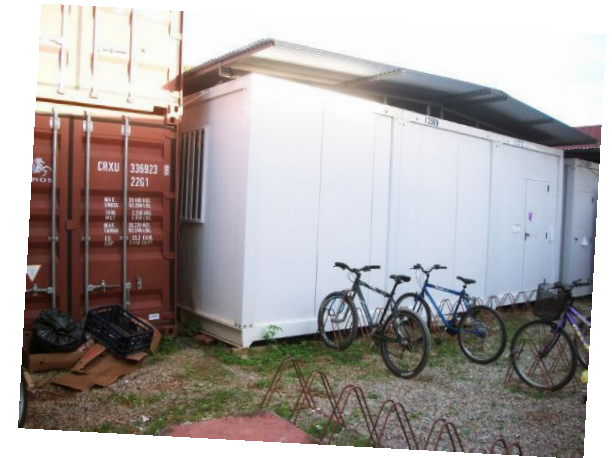
Um dos containers nos quais temos aulas – UFF/PURO

É importante que os moradores de Rio das Ostras e da região conheçam a UFF e os problemas que a comunidade acadêmica vem enfrentando, pois o futuro da UFF tem relação com o desenvolvimento local, por exemplo, para formação profissional superior, para produção de conhecimento científico sobre os problemas locais e, principalmente, para propor soluções às necessidades apresentadas pela comunidade local.